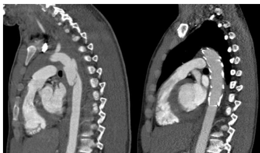
Linkes Bild: Darstellung einer Aortenruptur loco typico mittels CT-Angiographie; Rechtes Bild: Erfolgreich eingebrachte Endoprothese mit suffizienter Ausschaltung der Aortenruptur

Die operative Sanierung muss so schnell wie möglich durchgeführt werden. Bei polytraumatisierten Patienten müssen Prioritäten festgelegt werden. Intrakranielle und abdominelle Blutungen müssen vorrangig behandelt werden. Aufgrund der geringen Invasivität und Komplikationsrate der endovaskulären Therapie kann diese unmittelbar nach der Stabilisierung des Patienten durchgeführt werden. Dabei wird über einen inguinalen Zugang die Endoprothese eingeführt und im thorakalen Bereich abgesetzt um die Transsektion zu überbrücken.